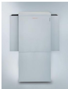
Do ustawienia na zewnątrz budynku