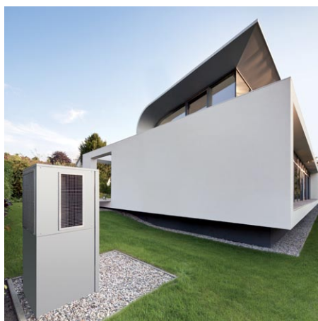
Vitocal 300-A do ustawienia na zewnątrz budynku (Silent-Version)

Poziom hałas pracującej pompy ciepła Vitocal 300-A jest szczególnie niski w segmencie tego typu urządzeń, dzięki zastosowaniu wentylatora promieniowego z regulacją prędkości obrotowej i obniżaniu jego wydajności w trybie pracy nocnej.