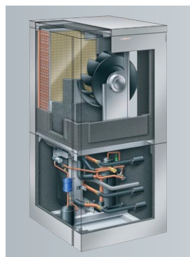
Vitocal 300-A do ustawienia wewnątrz budynku

Vitocal 300-A jest pompą ciepła powietrze/woda z technologią Digital Scroll i elektronicznym zaworem rozprężnym Biflow. Dzięki temu uzyskuje bardzo wysoki wskaźnik efektywności energetycznej w ciągu roku. Przykładowo, przy temperaturze powietrza 2^{\circ}\text{C} i temperaturze wody grzewczej 35^{\circ}\text{C} , współczynnik efektywności energetycznej (COP), wynosi: 3,9. Tym samym Vitocal 300-A jest szczególnie niezawodną pompą ciepła, jeśli chodzi o zaopatrzenie w ciepło. A przez to również znacznie obniża koszty eksploatacji.