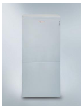
Do ustawienia wewnątrz budynku