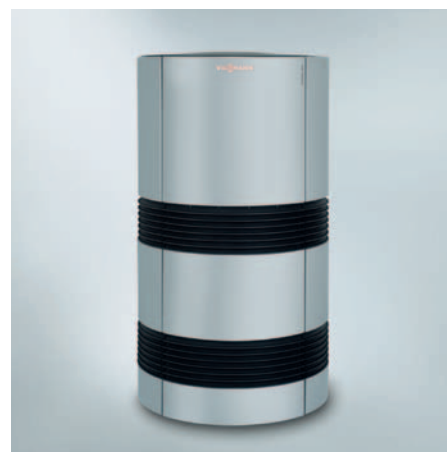
Vitocal 300-A do ustawienia na zewnątrz

Dodatkowe oszczędności na kosztach eksploatacji są możliwe przy wpięciu instalacji fotowoltaicznej. Samodzielnie wyprodukowany prąd można użyć na przykład do zasilania sprężarki, regulatora, pomp i wentylatora pompy ciepła Vitocal 300-A. Ponadto Vitocal 300-A jest już przystosowana do współpracy z sieciami inteligentnymi (Smart Grid).